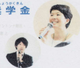
生活支援プログラム