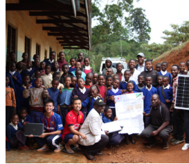
アフリカの非電化地域にICT教育機会を創るプロジェクト

神奈川のNGOなどが行う海外の開発途上地域での協力活動、外国人住民等を対象とした県内での協力・支援活動、民際協力の担い手を育成するための活動、NGOの育成・充実を図るための活動、災害時などの緊急支援活動、多文化共生の地域社会づくりの活動などに資金助成を行っています。